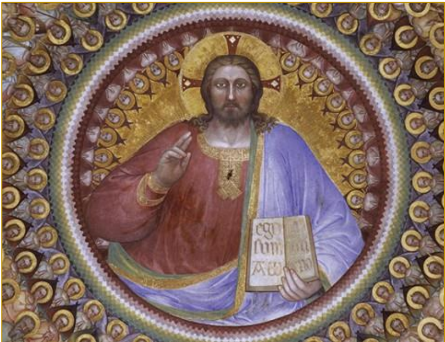
Christ Pantocrator, Alpha en Omega. Giusto de' Menabuoi (1320–1391)

We moeten allen voor de rechterstoel van Christus openbaar worden.